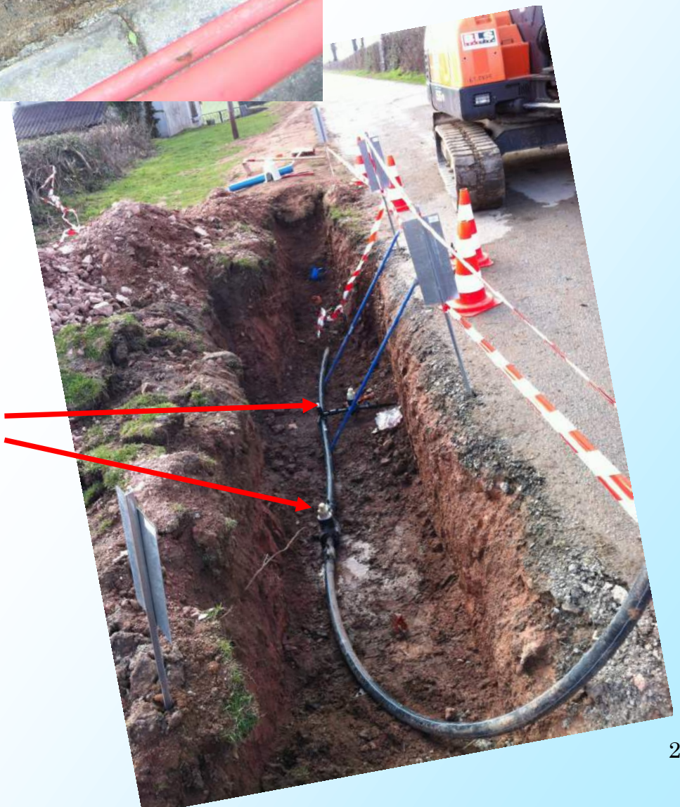
branchement et purge par technique d'electrosoudage