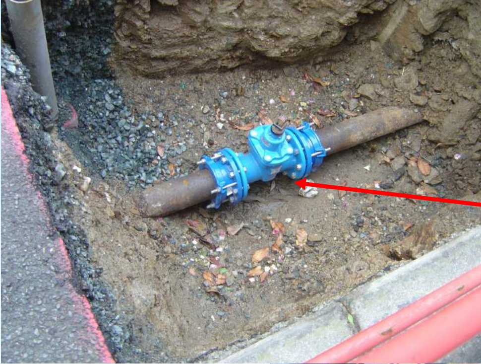
montage de robinet vanne